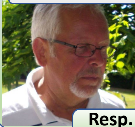
Resp. Site Internet Animateur